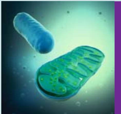
Mitochondrien waren als Einzeller, so die Evolutionsbiologen, in der „Ursuppe“ die Vorläufer höheren Lebens

Bei der Cellsymbiosis-Therapie handelt es sich um ein ganzheitliches Therapiekonzept, das die Stoffwechselprozesse in den Körperzellen gezielt beeinflusst. Die Entgiftung wird